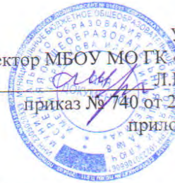
График проведения праздничных мероприятий в День знаний 1 сентября 2020 года