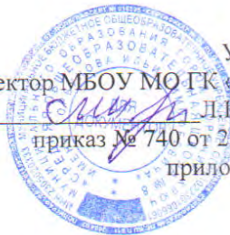
График проведения уроков 2 сентября 2020 года